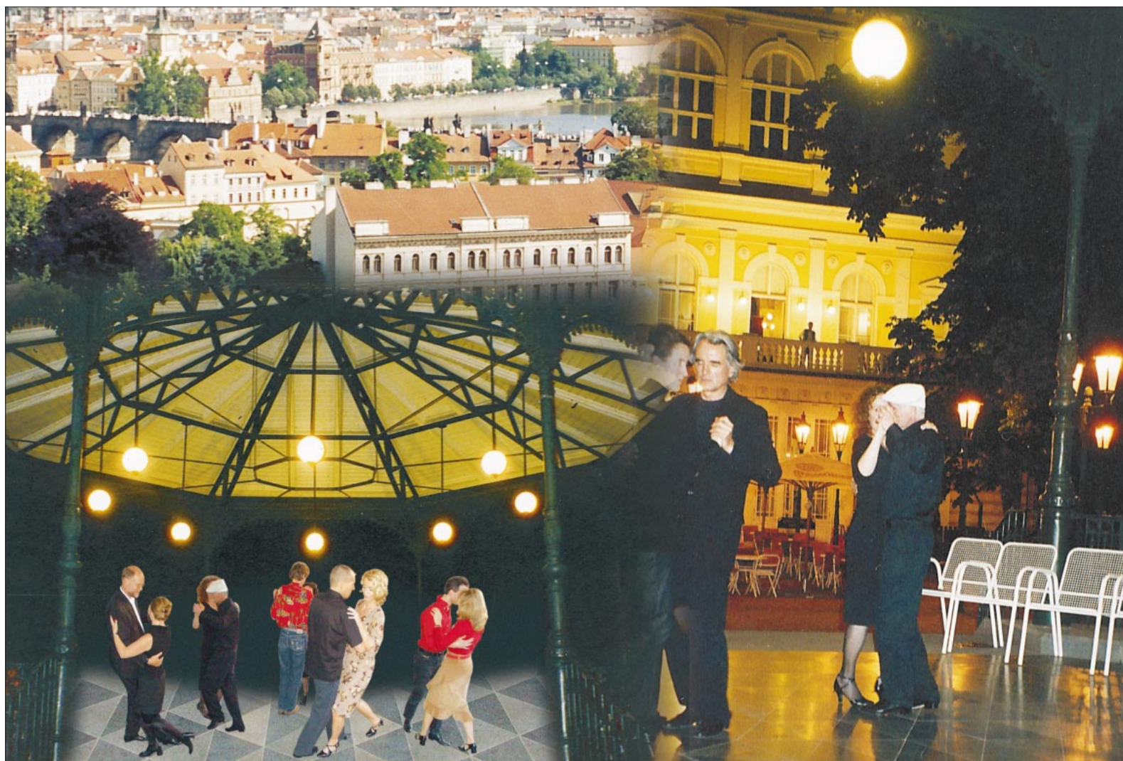
Tanzen im romantischen Ambiente der goldenen Stadt.

Während nach den Kursen die Schönheiten der Goldenen Stadt entdeckt wurden, ob man nun im Café Louvre erlesene Prager Kaffeehauskultur genoss, zur Burg emporstieg, über die Karlsbrücke